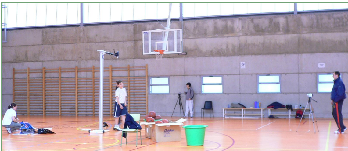
Figura 1. Posición de las tres cámaras con las que se filmaron los tiros libres.

Todos los jugadores participantes en el estudio realizaron diez lanzamientos en cada una de las situaciones descritas en la tabla 1. Se filmaron un total de seiscientos treinta tiros, setenta tiros por cada uno de los nueve participantes estudiados.