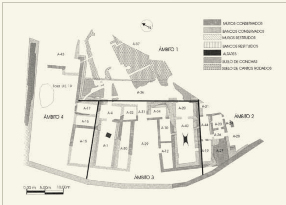
A la izquierda, planta del santuario fenicio de El Carambolo (Camas, Sevilla).