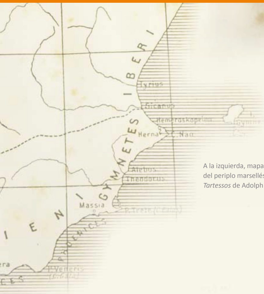
A la izquierda, mapa del Reino de Tartessos en el tiempo del periplo marsellés (c520 a. J. C.) publicado en el libro Tartessos de Adolph Schulten.