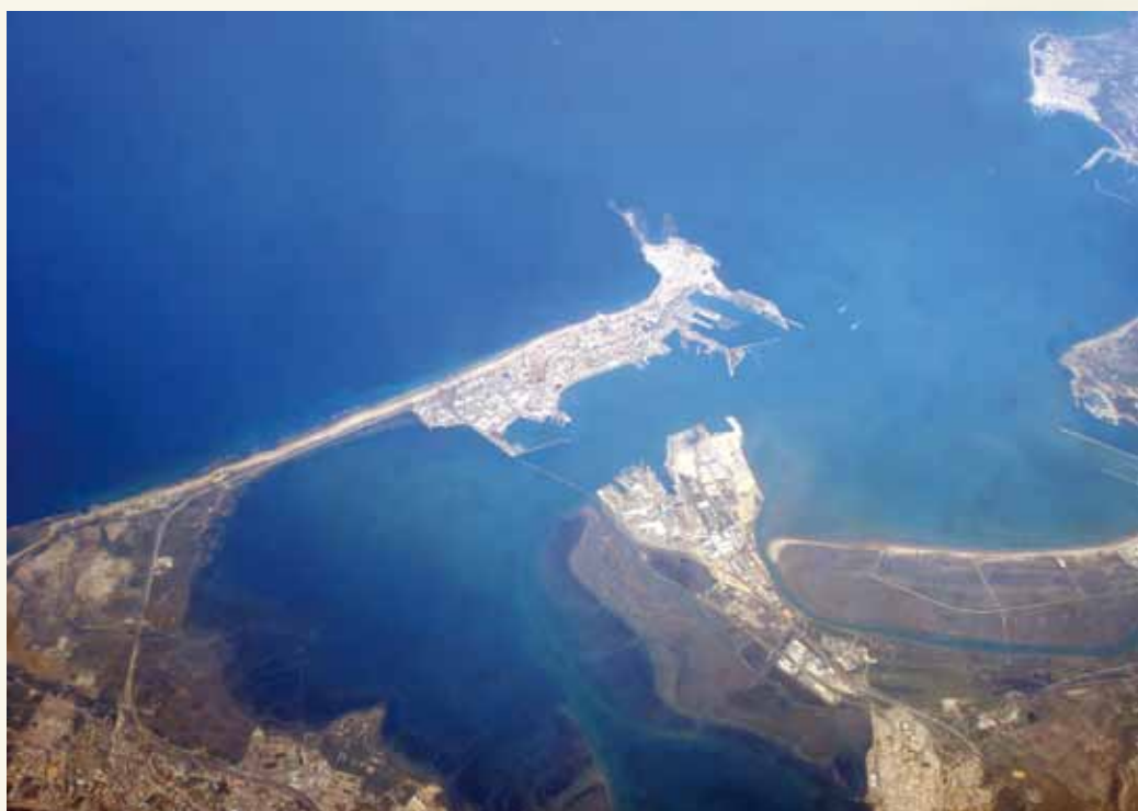
A la derecha, vista aérea de la bahía de Cádiz.

componente fenicio podría estar detrás de las menciones a Tartesos. Si estas hipótesis se confirman, volvería a evidenciarse que el avance en el conocimiento histórico depende tanto de la aparición de nuevos datos como de la aplicación de nuevas miradas a viejos problemas. ●