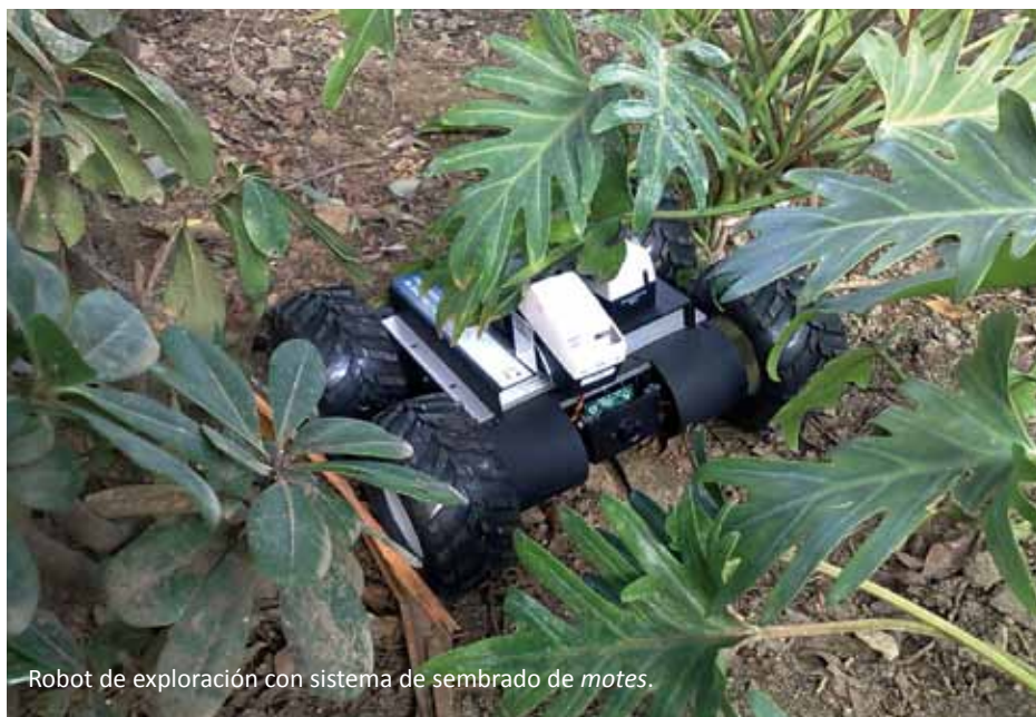
Robot de exploración con sistema de sembrado de notes .

Los sistemas de seguimiento han llegado también a la tecnología aeroespacial. Desde hace algunos años disfrutamos de los sistemas de posicionamiento global (GPS). En la actualidad se disponen de satélites cuyos sensores permiten estudiar la evolución del clima en la Tierra, o investigar sobre aspectos tan relevantes como la dinámica marina, la evolución de la vegetación, los desiertos y los glaciares, entre otros. La conjunción de esta tecnología, que incluye distintos tipos de sensores (sistemas de visión, infrarrojos,