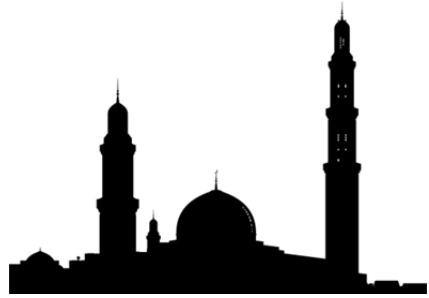
Estambul, Turquía.

Esta conclusión es especialmente interesante a la luz de las reflexiones de Byatt en el capítulo de cierre de su colección de ensayos On Histories and Stories (2000), titulado “The Greatest Story Ever Told”. Aquí, tratando de dar respuesta a la pregunta de cuál podría ser la mejor historia jamás contada, la autora se centra en Las mil y una noches y analiza la intersección entre vida y narración en estos términos: “storytelling is intrinsic to biological time, which we cannot escape. [...] Stories are like genes, they keep part of us alive after the