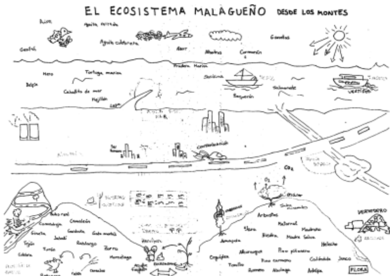
Fig. 2. Póster final grupo 7

evoluciones destacables, dado que hay 10 y 9 grupos respectivamente en los dos niveles más elevados (Tabla 1), dado que establecen alguna relación explícitamente (Fig. 2).